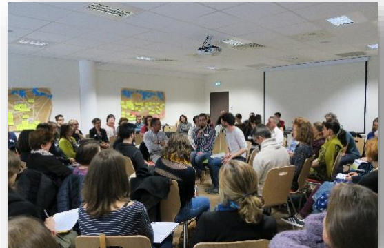
Cercle excentrique réalisé au cours de la journée du 12 mars 2018 sur les QSV organisée par le Pôle ESE ARA

Dépasser l'opposition entre rationalité scientifique et rationalité sociale peut « permettre au collectif de se réapproprier la décision » (Simonneaux 2016). C'est à toutes ces conditions que pourront se développer une prise de position en conscience ainsi que la construction collective de solutions, et la possibilité d'un engagement