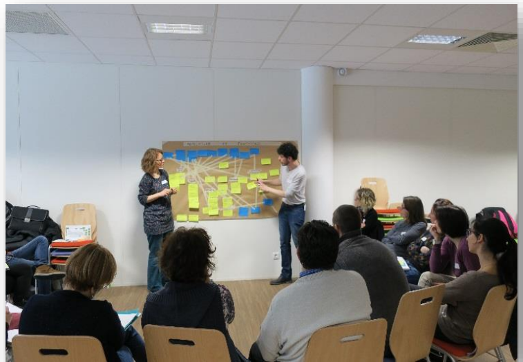
Construction d'une carte de représentation des controverses lors de la journée du 12 mars 2018 sur les QSV organisée par le Pôle ESE ARA

http://www.theatredelopprime.com/compagnie/theatre-forum/